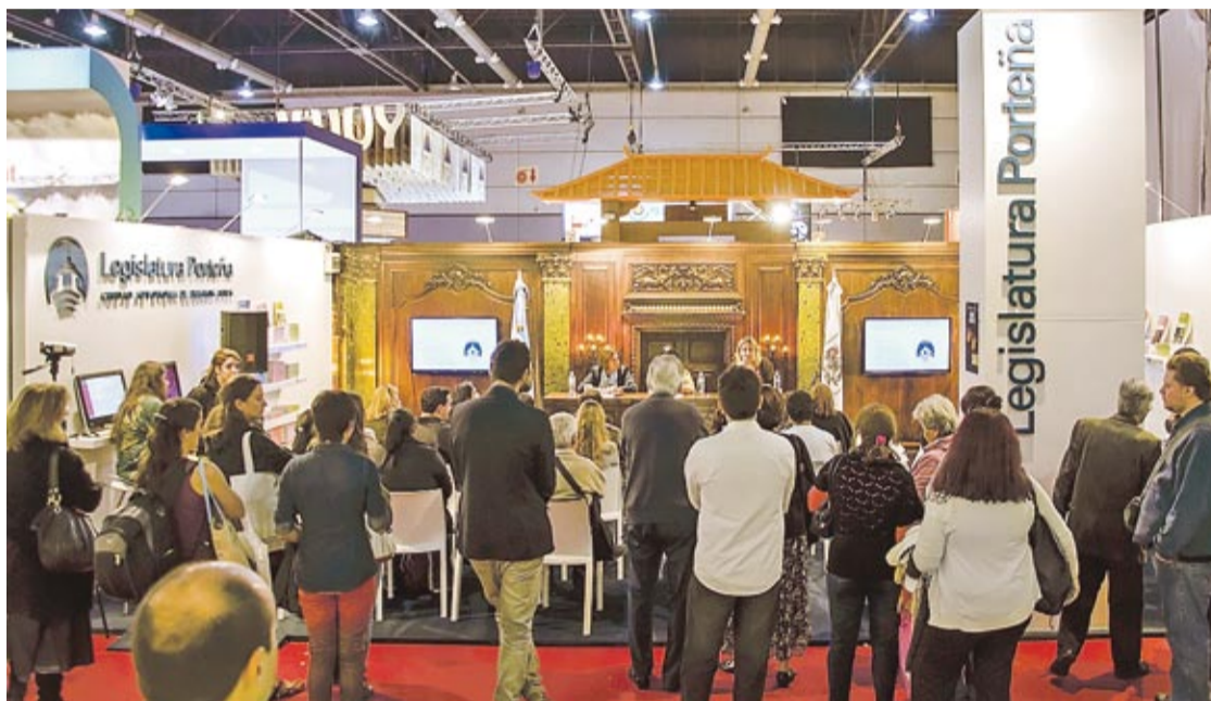
A TRAVÉS DE JUEGOS INTERACTIVOS Y DIDÁCTICOS SE INFORMO SOBRE EL PROCESO DE FORMACION DE LEYES.

Personas de todas las edades pudieron conocer y recorrer las instalaciones de la sede parlamentaria a través de monitores táctiles que en formato de "realidad aumentada" les permitieron trasladarse virtualmente a los salones Dorado, Eva Perón,