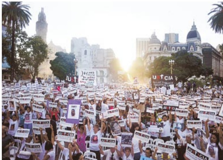
HOMENAJE EN PLAZA DE MAYO, EL PASADO 22 DE FEBRERO. A UN AÑO.