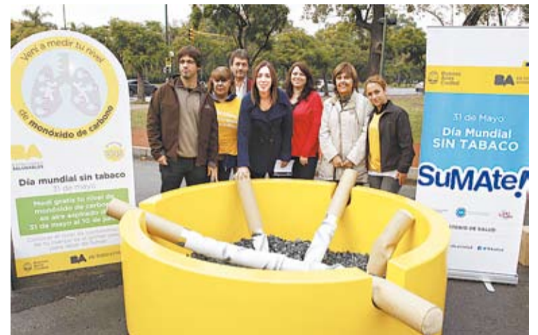
LA VICEJEFA DE GOBIERNO PORTEÑO, EN LA "ESTACION SALUDABLE".