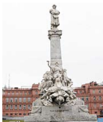
LA ESTATUA DE COLON.

Se hizo a propuesta del jefe de Gobierno de la Ciudad, Mauricio Macri, y el bloque del Frente pa-