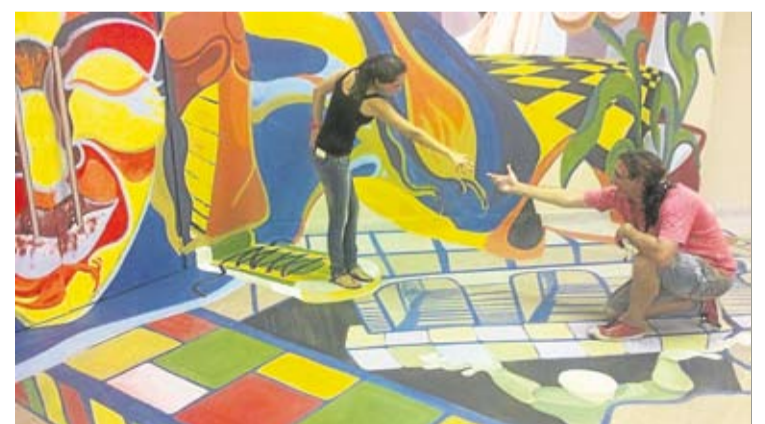
LOS PEATONES PODRAN DISFRUTAR LA OBRA DE DANIEL TACCONE.

El próximo fin de semana, el artista Daniel Taccone hará una intervención con una técnica de dibujo y pintura en tres dimensiones sobre la calle Perú al 100, frente al palacio legislativo de la Ciudad.