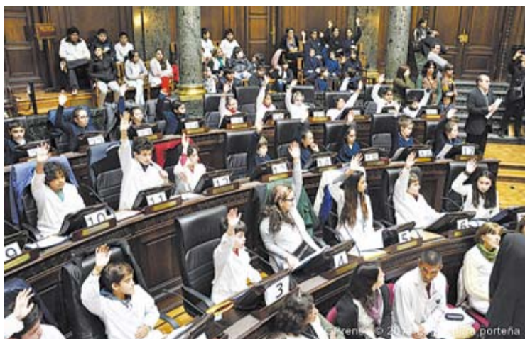
LA LEGISLATURA CONVOCO A LOS SECUNDARIOS PARA EL CONCURSO.

La convocatoria está orientada a los jóvenes de 4º, 5º y 6º de nivel medio de todas las escuelas de gestión pública y privada, dependientes del Ministerio de Educación de la Ciudad y tiene como objetivo profundizar el vínculo entre la Legislatura y las escuelas, mediante la elabora-